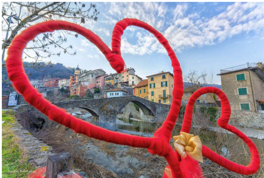
Figura 1 Foto anno 2022 Voltaggio

Mornese, Novi Ligure con 4 panchine, Parodi Ligure, Pasturana, Predosa, San Cristoforo con 2 panchine, Sardigliano, Serravalle Scrivia con 4 panchine, Stazzano, Tassarolo con 2 panchine, Vignole Borbera, Villalvernia, Voltaggio e Vendersi (Albera Ligure).