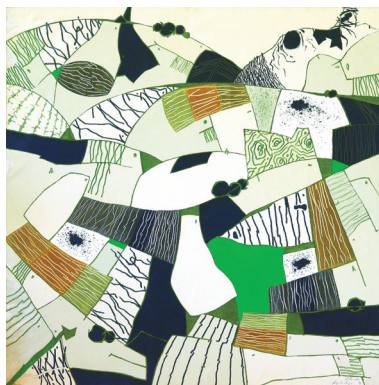
Langhe , 1981

nali e compie viaggi di formazione nel centro-sud d’Italia: Umbria, Lucania e Puglia. Viene ingaggiato come calciatore professionista dalla squadra di Albissola Marina (Savona), dove si trasferisce e vive dal 1954 al 1956. Qui ha il primo approccio col materiale ceramico e la manipolazione della materia argillosa, ma soprattutto entra in contatto con gli esponenti dell’avanguardia artistica nazionale e internazionale. Fra questi, Asger Jorn che nel 1954 lo ritrae in un dipinto a olio conservato al Museum Jorn di Silkeborg (Danimarca). Esordisce nel 1955 con una mostra personale alla Galleria Sant’Andrea di Savona, presentato da Emilio Zanzi, il critico che per primo riconosce nei suoi dipinti l’impiego di un segno personale e innovativo. Un segno che Ruga ha iniziato a utilizzare poco tempo dopo la sua formazione all’Accademia Albertina di Torino; un segno che appartiene alla tendenza astratto-informale , tipica del clima culturale che si respirava nel capoluogo piemontese in quegli anni, ma in una certa maniera differenziata rispetto alle ricerche dei coetanei Ruggeri, Ramella e Soffiantino, perché orientata verso una particolare forma d’astrazione gestuale, caratterizzata da tasselli di colore compatti al-