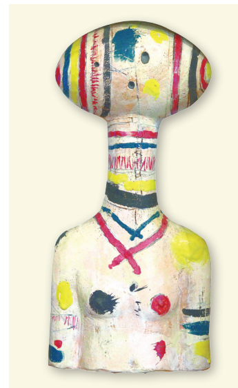
Senza titolo , 1992

ternati a velature e dissolvenze di tinte tenui e delicate. Per quegli anni si tratta certamente di una singolare gestualità ottenuta con segni rapidi, larghi e uniformi tracciati con un pennello dalla ghiera larga usando solo pochi colori. In particolare il nero, il grigio, il rosso, il marrone e l’ocra, con pennellate distese rapidamente e dove ogni colore definisce e delimita uno spazio. Una fase iniziale che fa già intuire come l’arte di Angelo Ruga non è mai stata un’avventura fantastica, ma il risultato di un meditato processo di pensiero e di analisi che ha preso avvio a partire proprio da quegli anni. Questi primi lavori rappresentano la base da cui, a poco a poco, nelle sue opere si afferma un mondo fatto di geometrie sghembe, mentalmente ritmate con forme e colori differenti che nel tempo hanno preso il posto e si sono sostituiti in una lenta progressione, alle precedenti macchie compatte e ai gestuali segni/spazio monocromi liberamente tracciati del primo periodo. Nel decennio successivo, ritorna alla pittura di paesaggio nei dintorni di Mongreno, il luogo dove si trasferisce e vive, e li popola di personaggi e maschere (spaventapasseri, arlecchini, soldati) che ne-