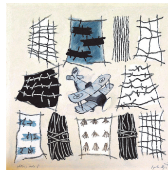
Ultimo volo? , 1999

gli anni Settanta escono dai quadri per diventare sculture polimeriche, nelle quali elementi plastici in legno e ceramica convivono con resti organici e oggetti residuali della cultura contadina. Col passare degli anni si concentra sempre più sulle visioni del paesaggio agreste e la sua pittura si fa via via più astratta, sorretta dalla forza sintetica della linea e da campiture cromatiche pure e piatte. Nascono i cicli delle Colline , degli Insetti , dei Giochi (1985-1990), dei Paesaggi immaginari (1990-1996). I quadri divengono più programmati, provengono da una inedita lettura del paesaggio, contengono una inderogabile sperimentazione intellettuale e conservano un segno nero non più gestuale, ma descrittivo e costruttore di forme. Ruga fa uso di un segno che col passare degli anni è diventato un elemento essenziale dell’espressione, carico di indizi, rivelatore di pulsioni interne, il primo grado di una forma in divenire. Nel 1993 acquista un’antica dimora a Clavesana nelle Langhe dove, dapprima trasferisce il suo studio, poi l’abitazione e infine vi si spegne nel 1999. La mostra, allestita nelle sale espositive del Castello di Monastero Bormida, offre una vasta panoramica di questo grande artista. La curatela dell’esposizione è affidata a Rino Tacchella in collaborazione con le Associazioni Culturali Angelo Ruga e Museo del Monastero .