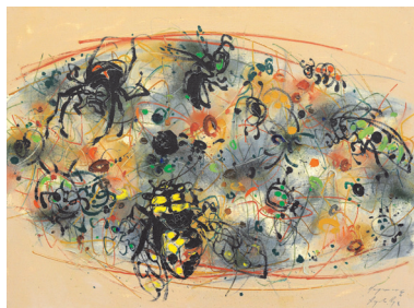
Mondo minimo , 1966

“Perché l’opera d’arte prenda fiato deve diventare una costruzione senza peso, contenitore di vuoti, come il pane che lievita, come la musica che da spazio al silenzio delle pause, come il disegno che da respiro al foglio, dove i vuoti dominano sui pieni.” è una frase di Arturo Martini che spesso Angelo Ruga ripeteva nel raccontare il suo percorso espressivo ricco di segni-disegni, di silenzi e di vuoti, di atmosfere e di poesia, una ricerca che si identificava completamente nella frase del grande scultore del Novecento. Segni che non sono il frutto di un gesto istintivo e immediato, ma una forma pensata che agisce e si situa in un certo modo, secondo una precisa disposizione. Un segno che non appartiene a una forma statica, ma è un segno in movimento, un segno lungo che descrive una forma intuibile più che reale. Angelo Ruga nasce nel 1930 a Torino, dove tra il 1948 e il 1957 si forma presso il Liceo Artistico e l’Accademia Albertina. Inizialmente dipinge paesaggi tradizio-