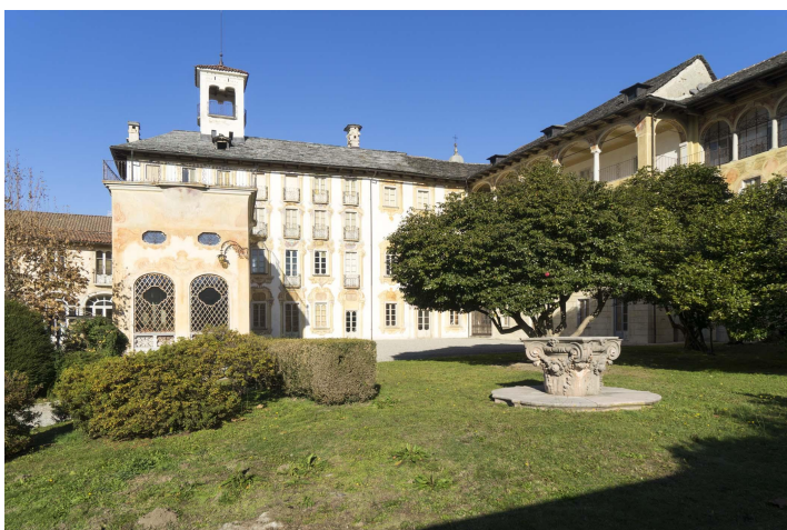
Villa Nigra a Miasino

Affacciata su piazza Beltrami del comune di Miasino da un lato e sulla strada principale dall'altro, Villa Nigra è uno dei monumenti di maggior rilievo del comune cusiano. Si tratta di uno splendido esempio di residenza aristocratica di campagna: fra le più significative della zona, non a caso attirò l'attenzione di Carlo Nigra, che ne seguì i restauri.