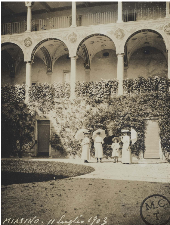
Foto di Carlo Nigra scattata nella corte di Villa Nigra