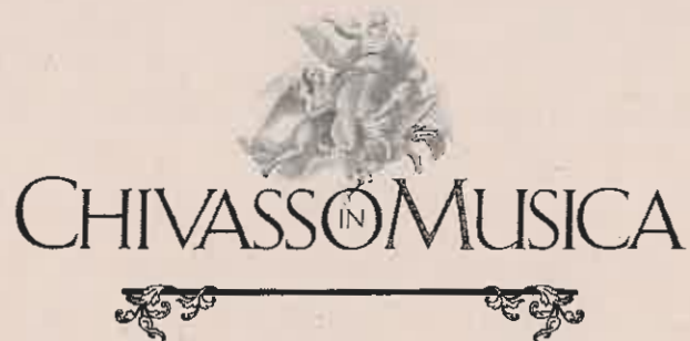
ILLUSTRAZIONE DETTAGLIATA DEL CARTELLONE

Il programma della stagione Chivasso in Musica 2021 prevede la realizzazione di sei appuntamenti concertistici nel periodo compreso tra il 6 luglio e l'11 dicembre. Tutti gli appuntamenti si svolgono senza biglietteria alcuna ma con ingresso a libera offerta.